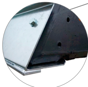
Serienmäßige Ausrüstung mit Grundblech 4 mm und aufgeschweißter Verschleißkante 80 x 8 mm